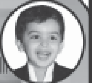
પુશ હેચુર નાગડા